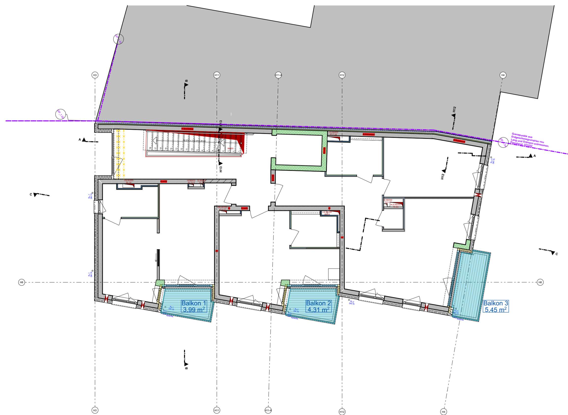
1.- 3. Obergeschoss