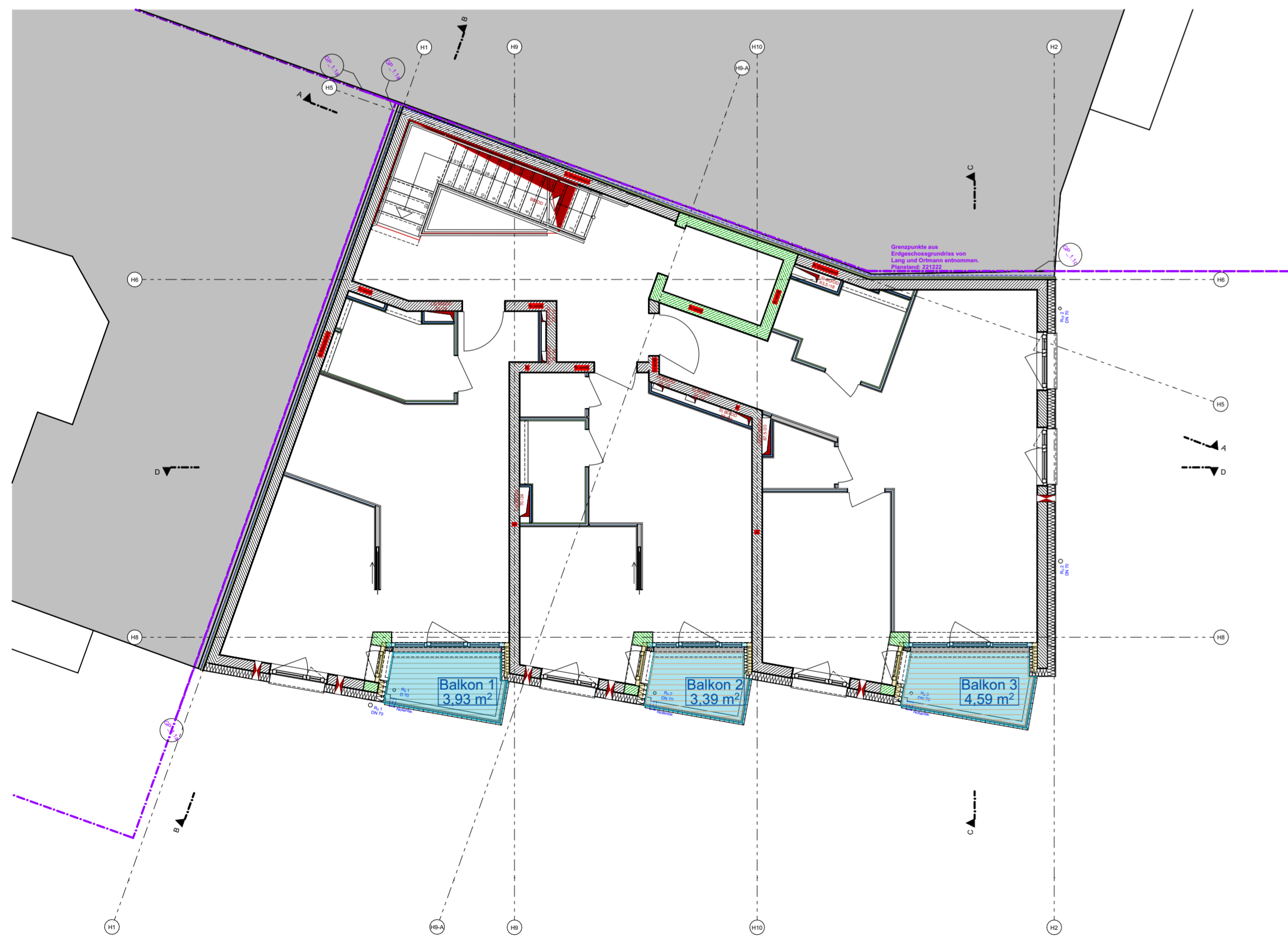
1.- 3. Obergeschoss